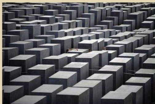
Мемориал жертвам холокоста в Берлине