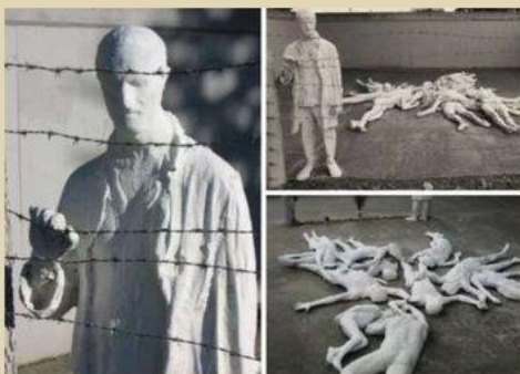
Мемориал «За колючей проволокой» (Сан-Франциско, США)

"Память о Холокосте необходима, чтобы наши дети никогда не были жертвами, палачами или равнодушными наблюдателями." — И. Бауэр